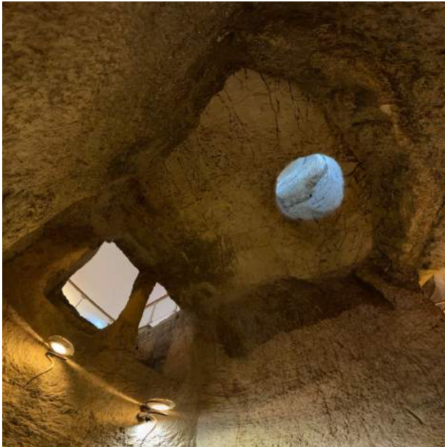
Fosa profunda, San Pedro Gallicanto

Esta noche en un momento de silencio y obscuridad acompañar en oración a Jesús en prisión. Elevar una oración por todos los condenados a prisión, por su conversión y por la justicia de los condenados injustamente y por sus familias.