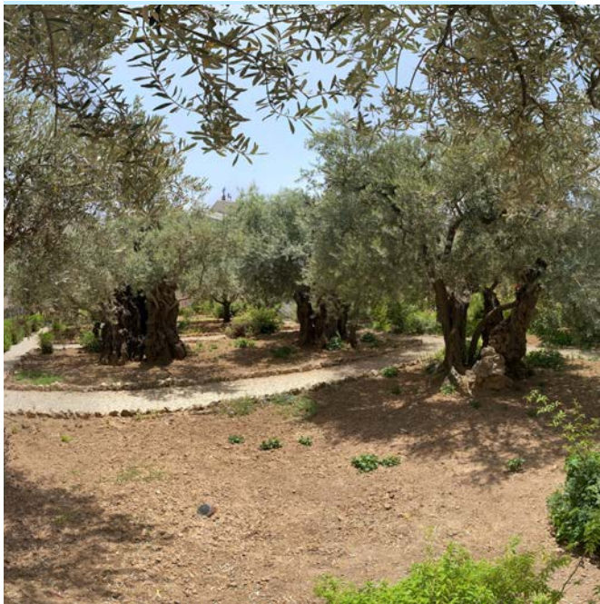
Huerto de los Olivos